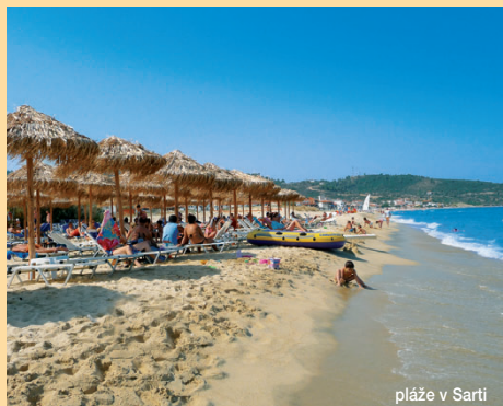
pláže v Sarti