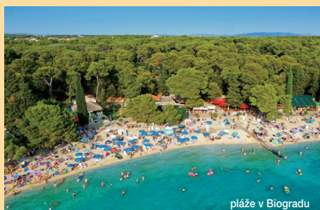
pláže v Biogradu