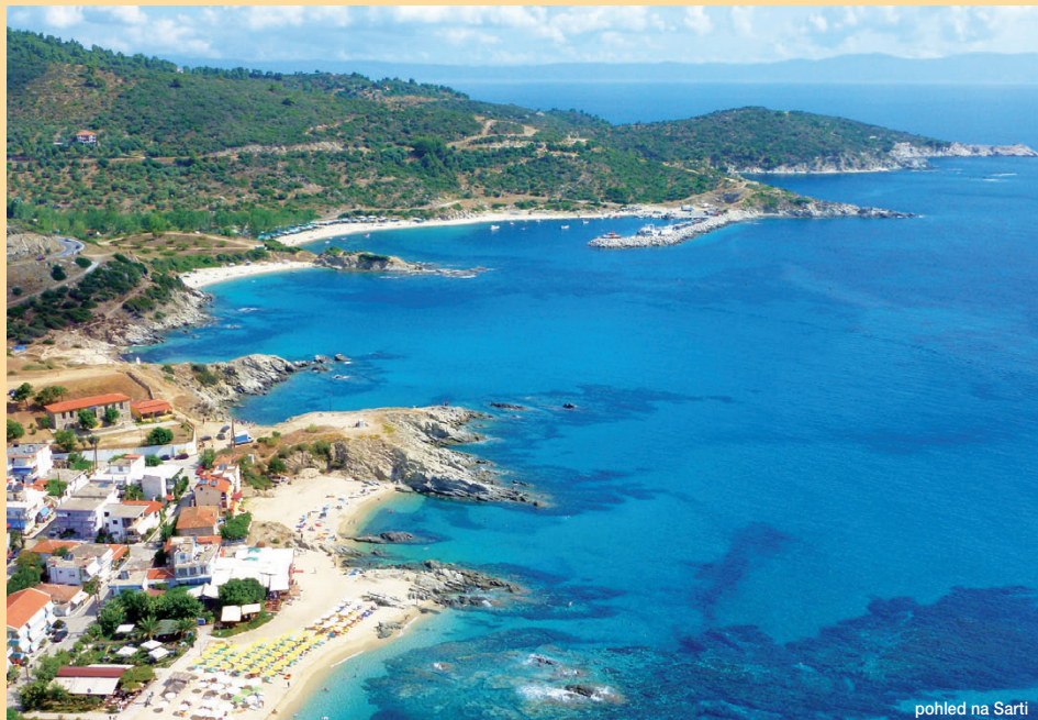
pohled na Sarti